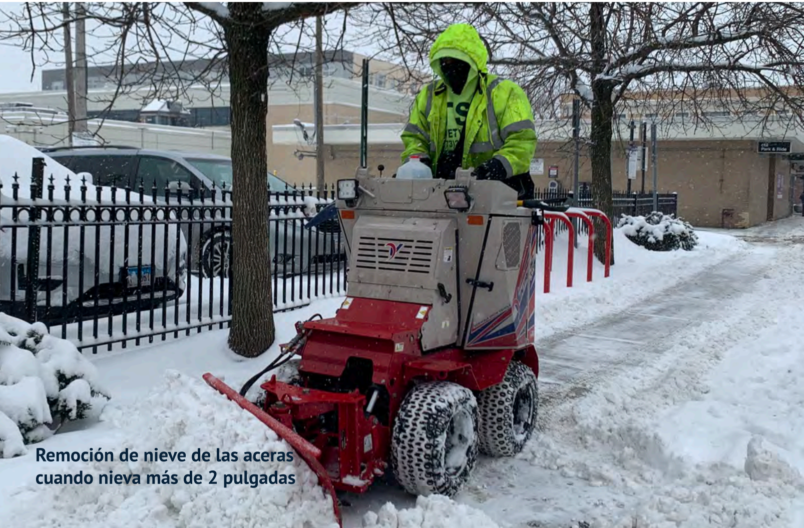
Remoción de nieve de las aceras cuando nieva más de 2 pulgadas