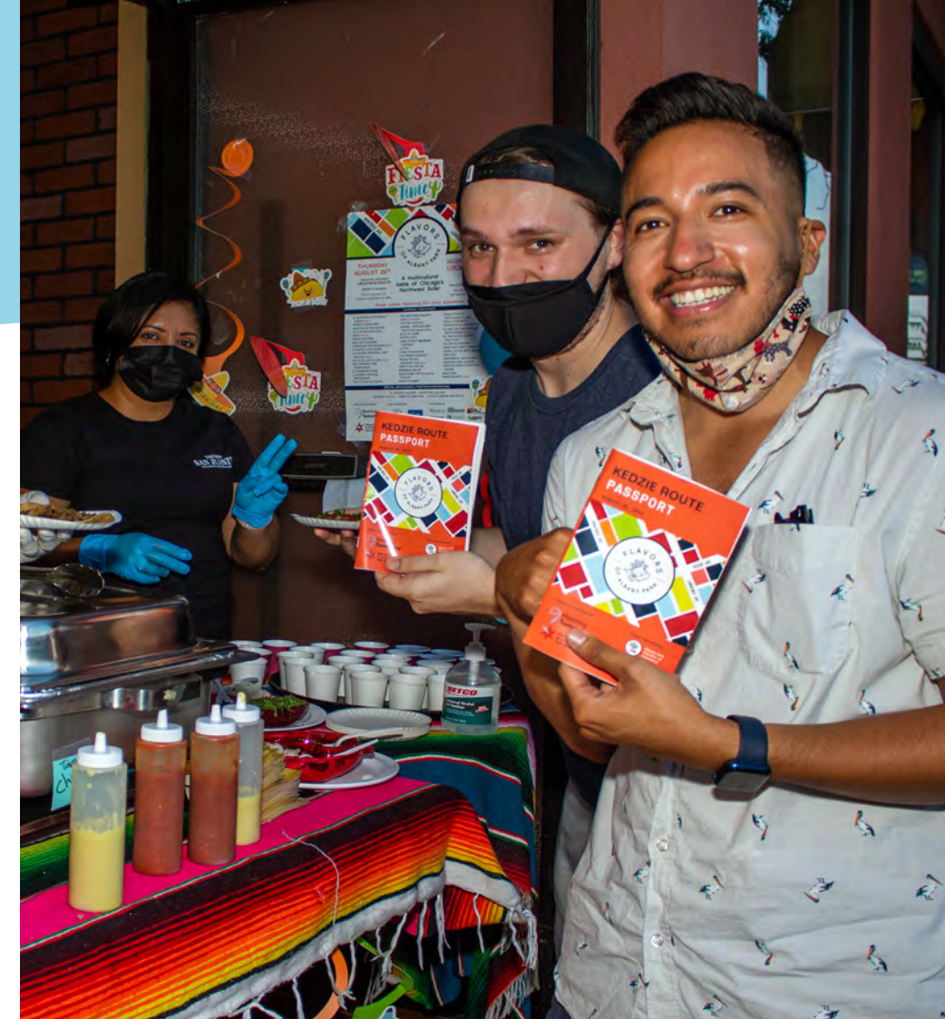
^ Festival Flavors of Albany Park 2021