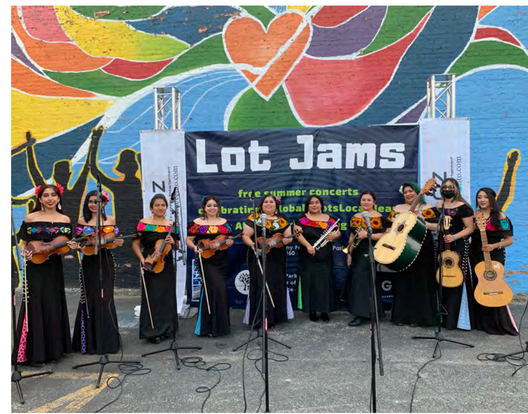
v Mariachi Sirenas en Lot Jams