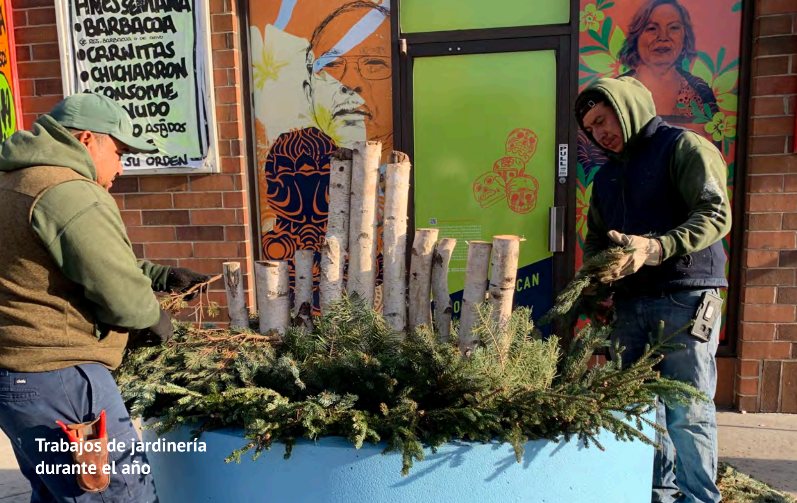
Trabajos de jardinería durante el año