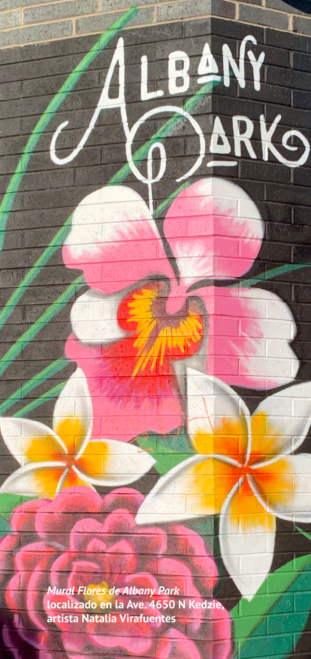
Mural Flores de Albany Park localizado en la Ave. 4650 N Kedzie, artista Natalia Virafuentes